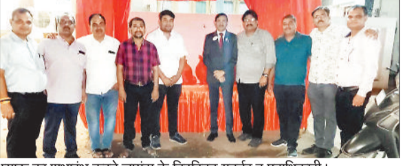
प्याऊ का शुभारंभ करते लायंस के डिस्ट्रिक्ट गवर्नर व पदाधिकारी।