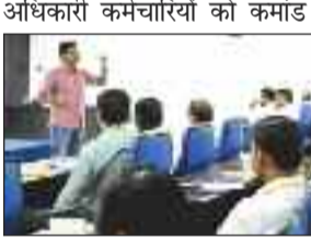
बैठक में जानकारी देते अधिकारी।