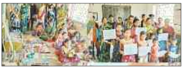
समरकैप में शामिल बच्चे।

पथलगांव। प्राथमिक शाला छिंदबहरी में ग्रीष्मकालीन अवकाश घोषित होते ही बच्चों की उत्सुकता को देखते हुए 10 दिवसीय समरकैप का आयोजन किया जा रहा है। समर कैप में बच्चों को विभिन्न प्रकार की शैक्षणिक और ज्ञानवर्धक गतिविधियां, खेल, नृत्य, गीत संगीत, आर्ट कुकिंग जैसी गतिविधियां सिखाए जा रहे हैं। शाला समिति व माताओं द्वारा बीच-बीच में सहयोग प्रदान किया जा रहा है। घर पर यह सब सिखने के लिए प्रेरित किया गया। साथ ही बताया गया कि जरूरत पड़ने पर घर में