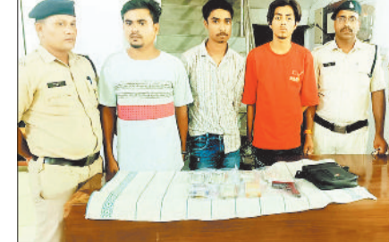
पुलिस गिरफ्तार में आरोपी।