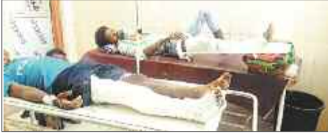
घायलों का अस्पताल में चल रहा इलाज।