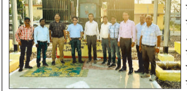
कोरबा। जिले के सुदूर वनांचल क्षेत्र में लो वोल्टेज की समस्या से निजात दिलाने के लिए विद्युत वितरण विभाग द्वारा ग्राम फरसवानी में सब स्टेशन स्थापित किया गया है।

कोरबा। जिले के सुदूर वनांचल क्षेत्र में लो वोल्टेज की समस्या से निजात दिलाने के लिए विद्युत वितरण विभाग द्वारा ग्राम फरसवानी में सब स्टेशन स्थापित किया गया है। सोमवार को सब स्टेशन को चार्ज कर दिया गया है जिससे इस क्षेत्र के लगभग दो दर्जन से अधिक गांव लाभान्वित होंगे और लो वोल्टेज की समस्या लगभग समाप्त हो जाएगी। उल्लेखनीय है कि कोरबा ग्रामीण क्षेत्र के अंतर्गत आने वाले फरसवानी व उसके आसपास के ग्रामीण क्षेत्रों में लंबे समय से लो वोल्टेज व पावर कट की समस्या थी। विद्युत वितरण विभाग के अफसर ने इस क्षेत्र की समस्या को गंभीरता से लिया था और इस क्षेत्र के ग्रामीणों को बेहतर विद्युत आपूर्ति हो सके इसके लिए फरसवानी में सब