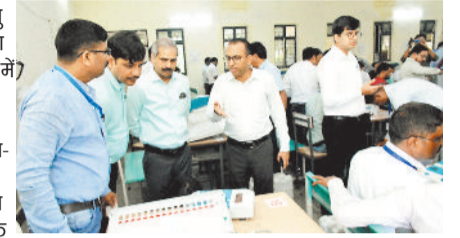
प्रेक्षक और कलेक्टर ने कमीशनिंग कार्य का किया अवलोकन

लोकसभा निर्वाचन को समग्रदृष्टा, पारदर्शिता एवं त्रुटिरहित सम्पन्न कराने हेतु जिले में निर्वाचन के दौरान उपयोग होने वाले ई-वोटिंग एवं वोटिंग मशीनों का कमीशनिंग सोमवार को इंगरहद स्थित आईटी कॉलेज में बनाए गए स्टूडिंग रूम में प्रारंभ हो गया है। सामान्य प्रेक्षक प्रेम सिंह मीणा, कलेक्टर एवं जिला निर्वाचन अधिकारी अजीत वसंत ने स्टूडिंग रूम में किए जा रहे कमीशनिंग कार्य का निरीक्षण किया। उन्होंने उपस्थित सभी अधिकारियों को निर्वाचन आयोग के दिशा-निर्देश अनुरूप एवं गोपनीयता बनाए रखते हुए कमीशनिंग का कार्य संपादित करने के निर्देश दिए। गौरतलब है कि लोकसभा निर्वाचन अंतर्गत 7 मई को होने वाले मतदान के लिए उपयोग होने वाली मशीनों के विधानसभावार कमीशनिंग के साथ ही सीलिंग का कार्य तेजी से पूरा किया जा रहा है। कमीशनिंग कार्य हेतु प्रशिक्षित अधिकारी-कर्मचारियों को ड्यूटी लगाई गई है। आज विधानसभा रामपुर एवं पाली तानाखर में निर्वाचन कार्यों में उपयोग होने वाले ईवीएम मशीनों का कमीशनिंग किया जा रहा है एवं शेष विधानसभा कटघोरा एवं कोरबा के लिए उपयोग होने वाले ईवीएम मशीनों का कमीशनिंग 30 अप्रैल को किया जाएगा।