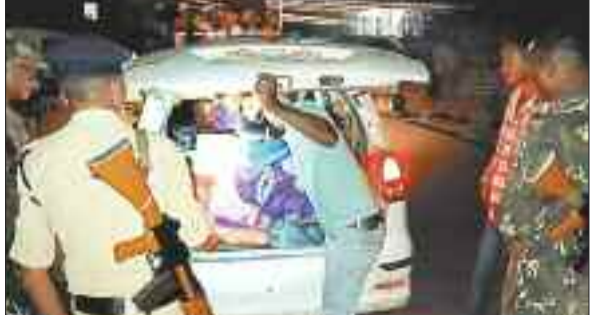
वाहन चेकिंग करती पुलिस।