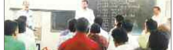
प्रशिक्षण प्राप्त करते अधिकारी- कर्मचारी।

जशपुरनगर। लोकसभा निर्वाचन 2024 हेतु मतदान दलों को द्वितीय प्रशिक्षण दिया जा रहा है। इसी कड़ी में आज जशपुर विधानसभा क्षेत्र हेतु नियुक्त मतदान दल के 545 अधिकारी-कर्मचारियों को महारानी लक्ष्मी बाई कन्या विद्यालय जशपुर में प्रशिक्षण दिया गया। जिसमें पीठासीन अधिकारी एवं मतदान अधिकारी क्रमांक 01 से 03 तक शामिल थे। प्रशिक्षण हेतु उपस्थित सभी कर्मी पथलगांव एवं कुनकुरी