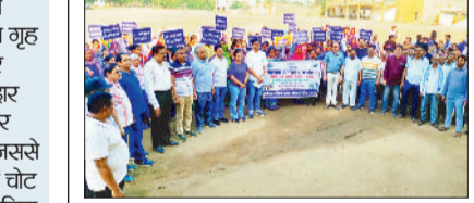
मतदाता जागरूकता रैली में शामिल स्कूली छात्राएं।