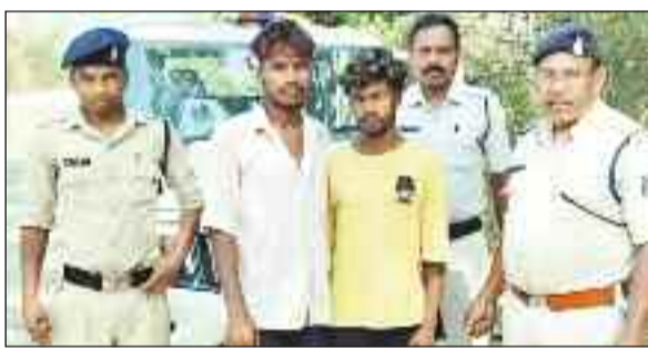
पुलिस गिरफ्त में आरोपी।